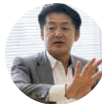
こと京都株式会社 代表取締役 公益財団法人 日本農業法人協会 会長