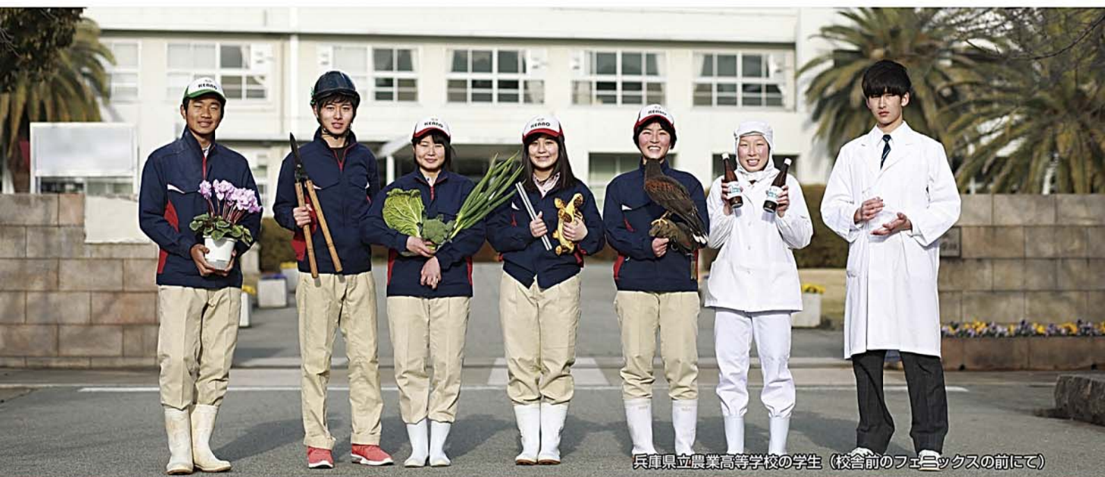
兵庫県立農業高等学校の学生（校舎前のフェニックスの前にて）

学生時代に農業を勉強した成果を発揮しよう！ 進学や就職に備えて農業知識のキャリアアップを図ろう！